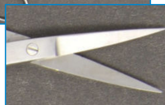
Traité avec du lait chirurgical